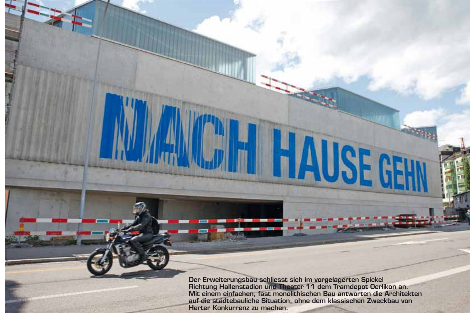
Der Erweiterungsbau schliesst sich im vorgelagerten Spickel Richtung Hallenstadion und Theater 11 dem Tramdepot Oerlikon an. Mit einem einfachen, fast monolithischen Bau antworten die Architekten auf die städtebauliche Situation, ohne dem klassischen Zweckbau von Herter Konkurrenz zu machen.