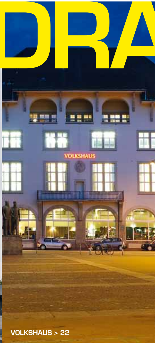
VOLKSHAUS > 22