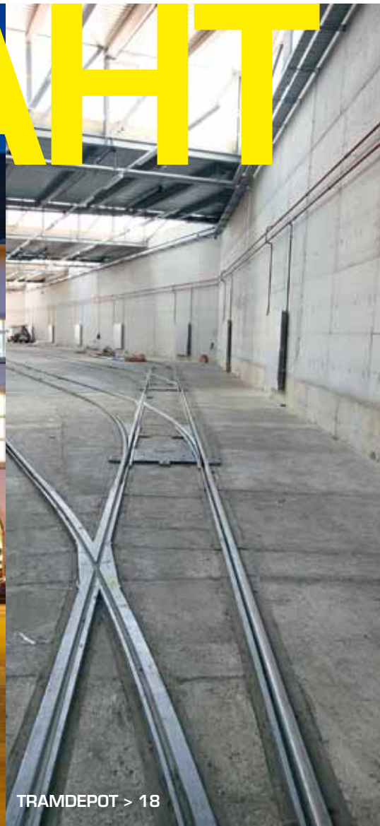
TRAMDEPOT > 18