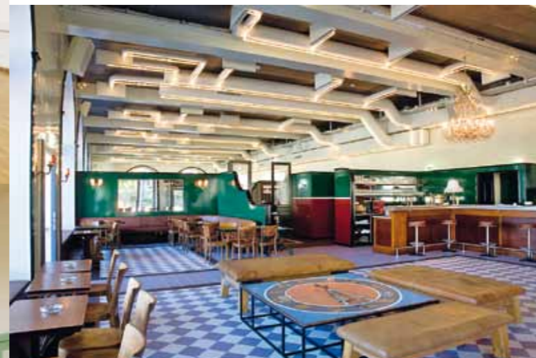
Bar/Restaurant: 2008 umgebaut und zum Treffpunkt avanciert

DAS VOLKSHAUS STEHT ALS GANZES UNTER DENKMALSCHUTZ. DA SIND BEI RENOVATIONEN UND UMBAUTEN IDEEN UND EINE ENGE ZUSAMMENARBEIT VON ALLEN BETEILIGTEN GEFRAGT.