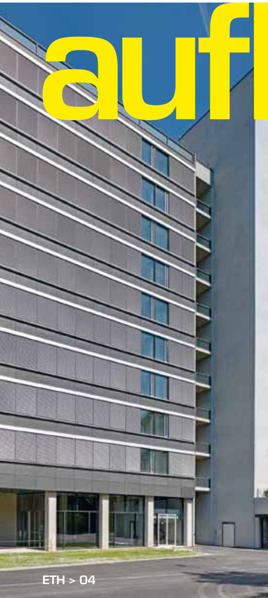
ETH > 04