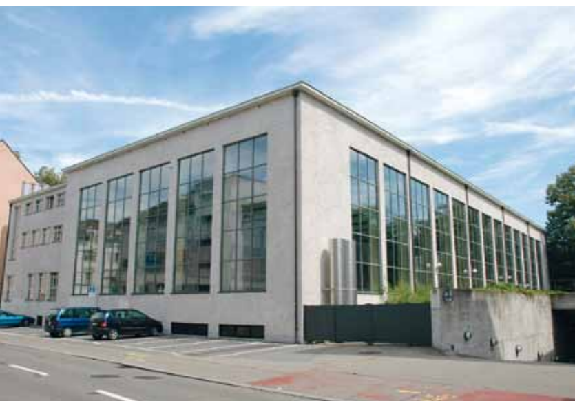
1979–2011 • Sicht Selnaustrasse und auf das 50-m-Becken

— Aufwendiger gestaltet sich da die Umsetzung der gültigen Vorschriften. So muss benutztes Badewasser vollständig abgeführt werden. Beim Nichtschwimmerbecken wird das Wasser bis 16-mal täglich ersetzt, im 50-m-Becken 3-mal. Die Luftumwälzung ist fast doppelt so hoch wie vor dem Umbau. Das gesamte Bad wird barrierefrei und damit rollstuhlgängig. Und natürlich wird die Energieeffizienz verbessert. Das geschieht mit Fenstern, die optisch in ihrem ursprünglichen Zustand belassen, aber mit zusätzlichen Gläsern versehen werden. Das Gebäude hat Wärmerückgewinnungsanlagen. Das Wasser wird dem Schanzengraben entnommen und dient der Vorerwärmung des Badewassers.